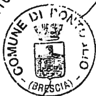
FIGURA PRIMA DI SCRITTURAZIONE